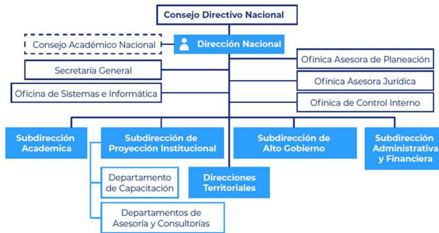
Ilustración 2 Estructura Orgánica ESAP (2020)

Decreto 219 de 2004, Decreto 300 de 2004; Decreto 2636 de 2005