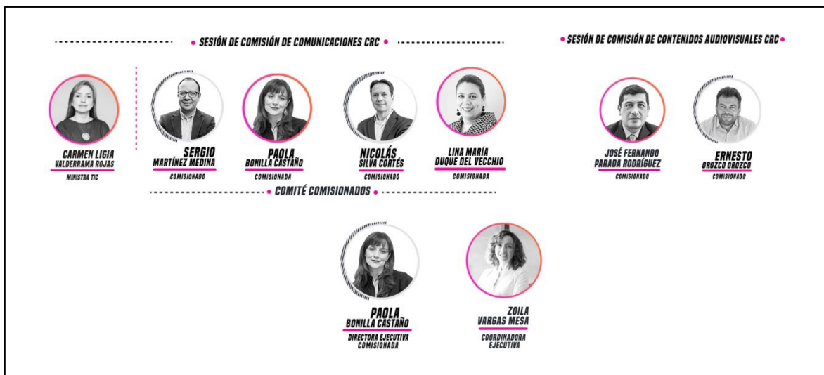
Gráfica 2. Organigrama CRC 2022