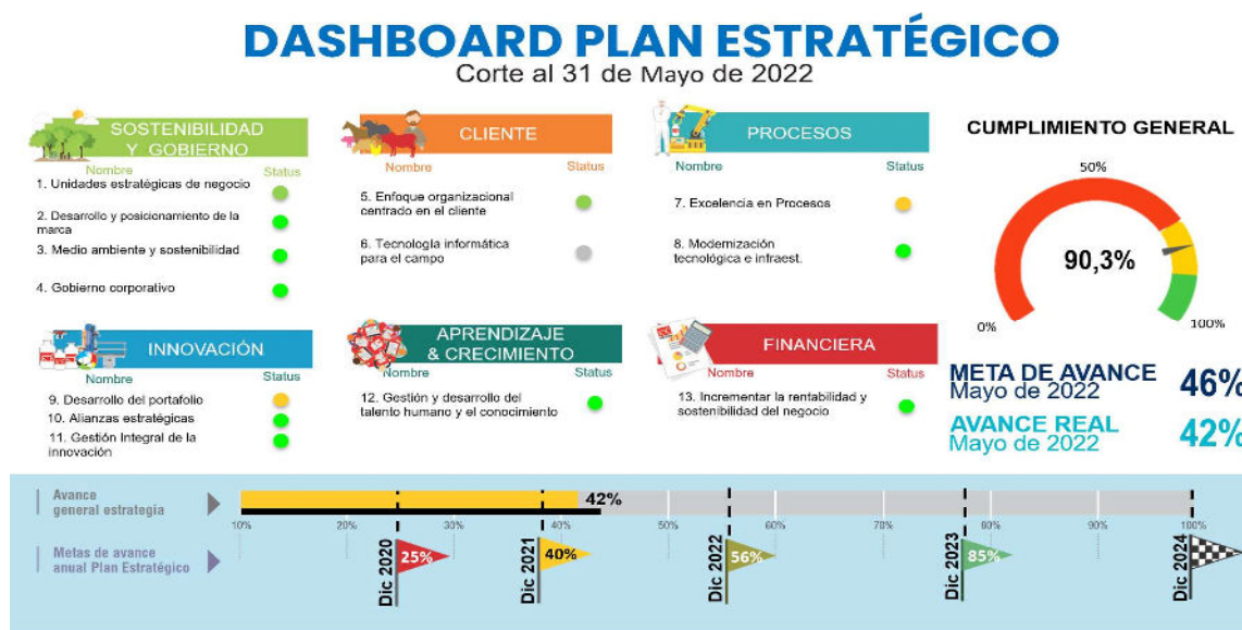
Tablero de control ejecución plan estratégico a 31 de mayo de 2022: