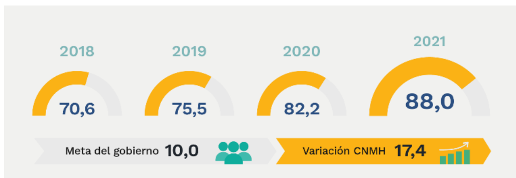
Figura 3. Resultados del índice de desempeño institucional.