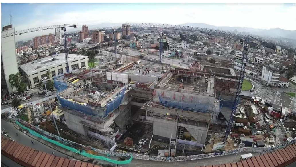
Figura 2. Panorámica construcción Museo de Memoria de Colombia.