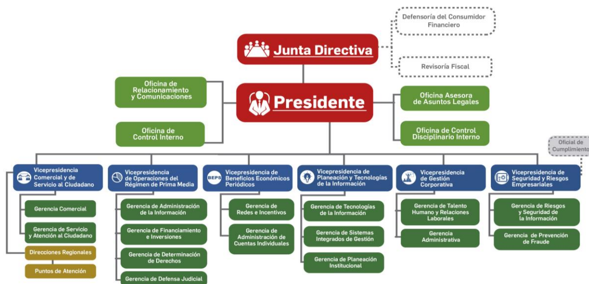
Estructura Orgánica de COLPENSIONES, Fuente: Gerencia de Planeación Institucional

COLPENSIONES al constituirse como una Empresa Industrial y Comercial del Estado (EICE) tiene como máximo órgano de decisión a la Junta Directiva que de conformidad con lo establecido en artículo 7° del Decreto 309 de 2017, está integrada por: un (1) representante del Ministro del Trabajo, un (1) representante del Ministro de Hacienda y Crédito Público y Tres (3) representantes del Presidente de la República.